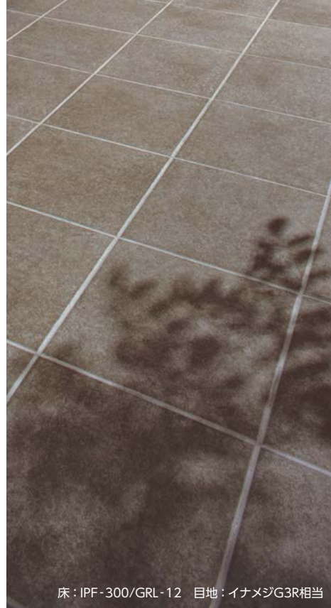
床：IPF-300/GRL-12 目地：イナメジG3R相当